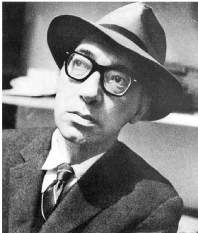
Juan Carlos Onetti (Montevideo, 1909 – Madrid, 1994)

Fue un escritor fundamental en la narrativa latinoamericana del siglo XX. Su obra, marcada por un tono existencial y pesimista, gira en torno a la ciudad ficticia de Santa María. Novelas como El astillero y La vida breve lo consagraron como precursor del realismo introspectivo. Onetti renovó el lenguaje narrativo con estructuras fragmentadas y personajes alienados. Su literatura, más sombría que la de sus contemporáneos, revela la angustia del individuo frente al mundo. Su reclusión voluntaria en sus últimos años de vida y su actitud cínica lo rodearon de un aura mítica.